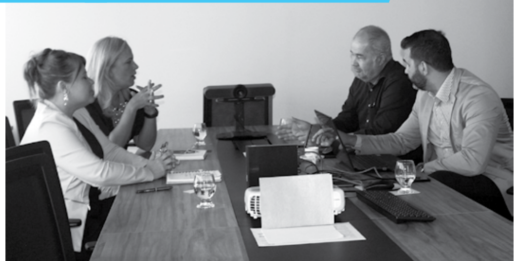
Reunião para apresentação de projetos, entre dirigentes da PBGás e da Cinep, aconteceu na última quinta-feira