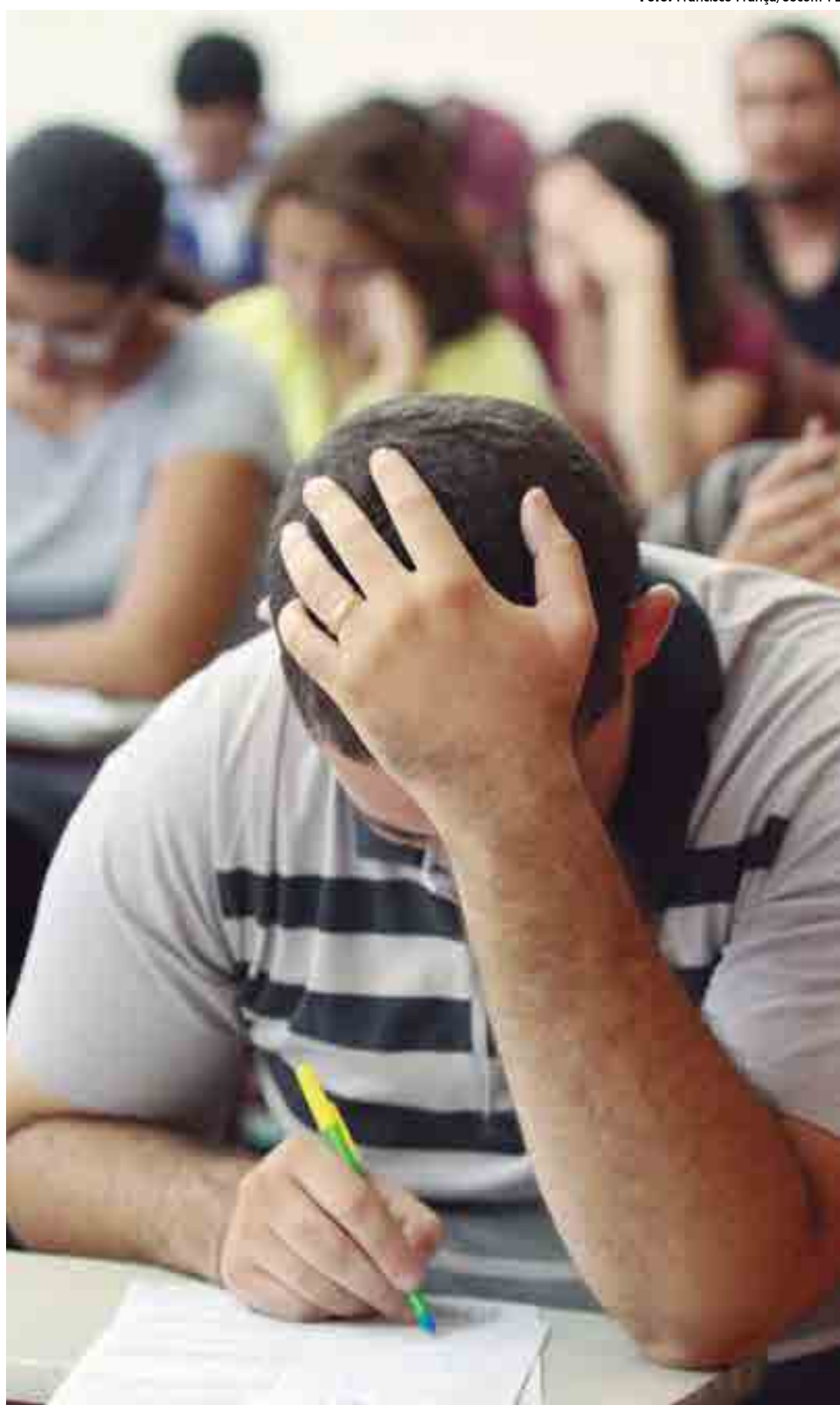
Interessados em participar do concurso precisam atender a requisitos, como ser brasileiro e ter bacharelado em Direito

Após a publicação do edital, a inscrição para o concurso público ficará aberta, no mínimo, durante 30 dias